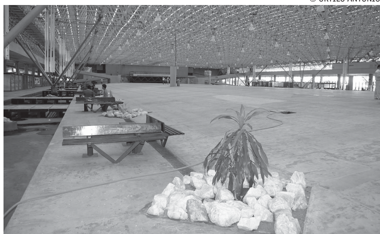
O evento terá como local o Espaço Cultural, na Capital, durante dois dias

O setor pesqueiro e aquícola participa da conferência com mais de 800 pessoas. O encontro na Paraíba aprovará propostas e elegerá 67 delegados à 3ª Conferência Nacional de