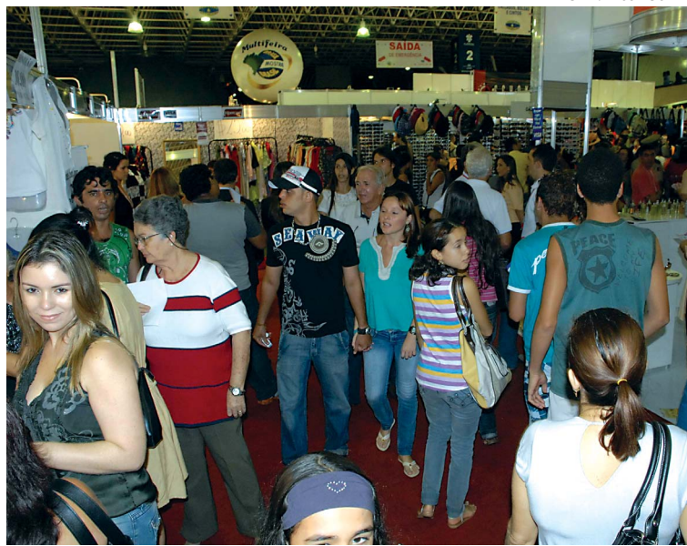
Público lotou os corredores na abertura da multifeira no final da tarde de ontem

O evento é visto pelo Governo do Estado como um impor-