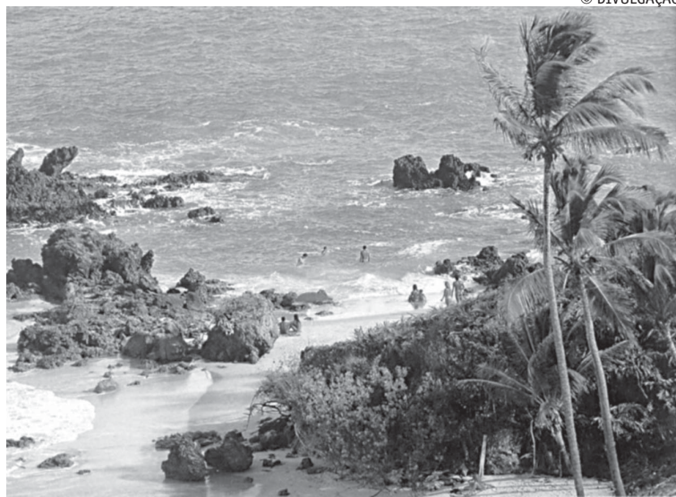
A praia de Tambaba, no Conde, é uma das mais visitadas pelos turistas

Às 14 horas, será redigida e apresentada a Carta de Tambaba. Nesta tarde será comemorado os 18 anos da praia de Tambaba, com a dramatização Tambaba-uma lenda viva e à noite, acontecerá "Nual", com jantar e música ao vivo, aberto ao público.