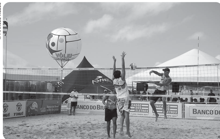
As disputas, iniciadas ontem na praia do Cabo Branco, vão até amanhã