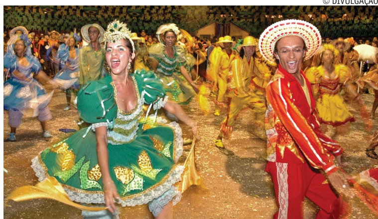
Quadrilhas juninas voltam a se exibir em festas juninas fora de época

A Festa de São Pedro 2009 também será realizada neste final de semana entre os dias 2 e 4, em dois municípios do Vale do Sabugi. São Mamede