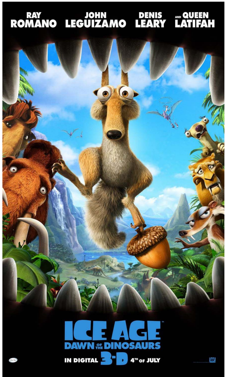
Com direção de Carlos Saldanha, 'A Era do Gelo 3' está em exibição, em João Pessoa