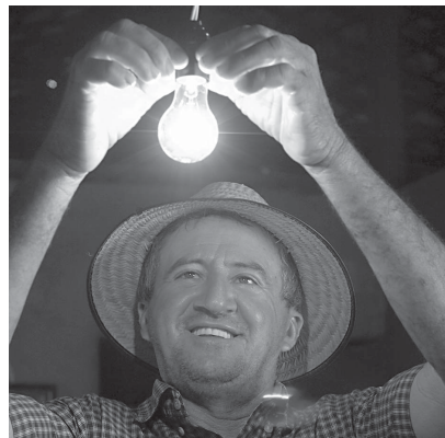
O consumo residencial de energia elétrica poderá ganhar tarifas flexíveis da Aneel

■ Aneel estuda uma ampla reestruturação do sistema de tarifas de energia no país, para estimular uma mudança de hábitos do consumidor brasileiro. O debate ainda será submetido a uma audiência pública